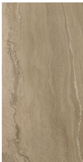
30 x 60 cm (12 x 24) Fini mat OV.SH.TPE.1224.MT