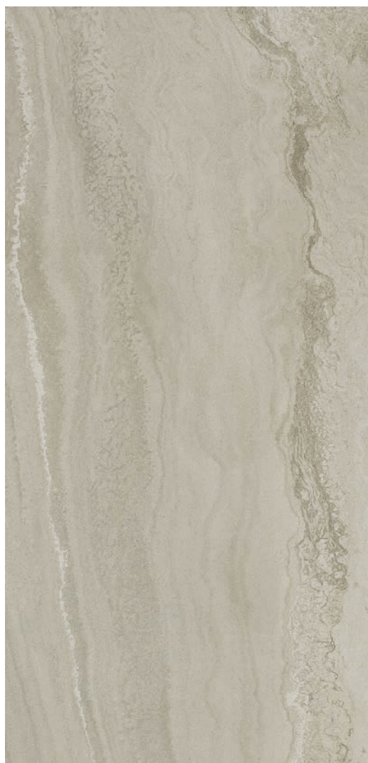
60 x 120 cm (24 x 48) Fini mat OV.SH.GRY.2448.MT