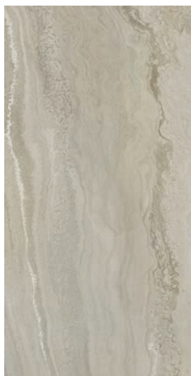
30 x 60 cm (12 x 24) Fini mat OV.SH.GRY.1224.MT