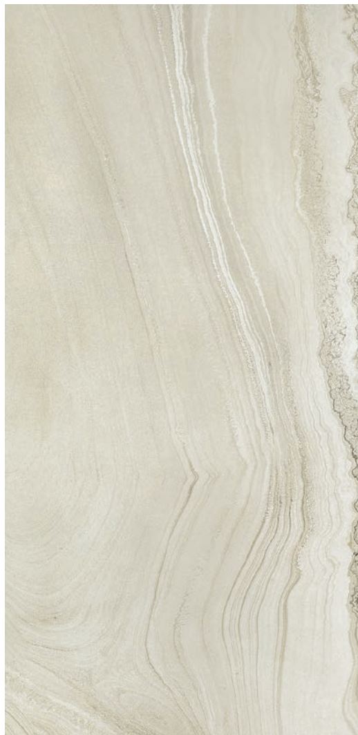
60 x 120 cm (24 x 48) Fini mat OV.SH.WHT.2448.MT