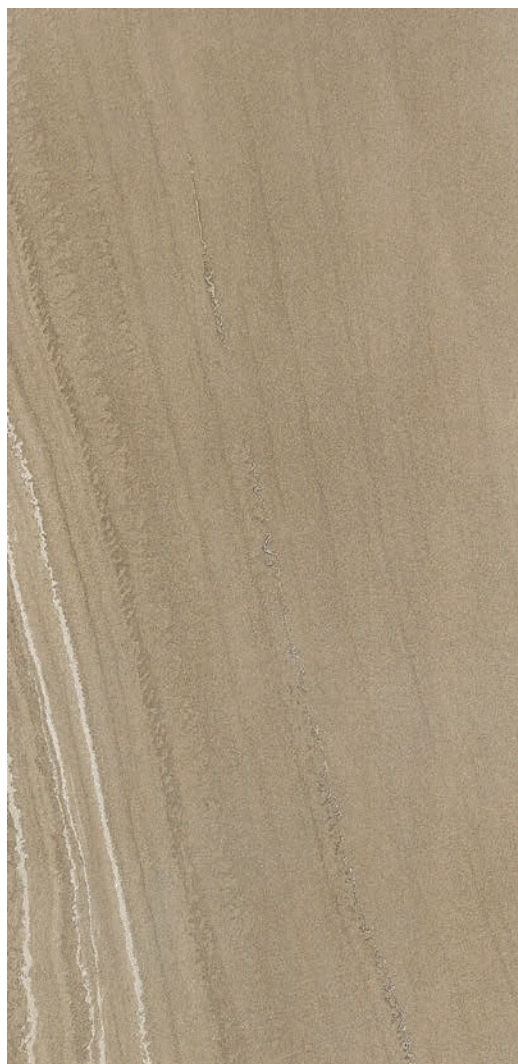
60 x 120 cm (24 x 48) Fini mat OV.SH.TPE.2448.MT