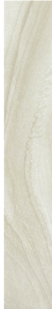
20 x 120 cm (8 x 48) Fini mat OV.SH.WHT.0848.MT.OS