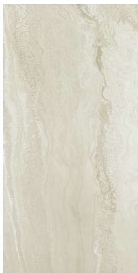
30 x 60 cm (12 x 24) Fini mat OV.SH.WHT.1224.MT