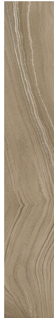
20 x 120 cm (8 x 48) Fini mat OV.SH.TPE.0848.MT.OS

Tous les items présentés dans ce document font partie du programme d'inventaire Olympia. Pour les commandes spéciales, veuillez contacter votre représentant de Tuiles Olympia.