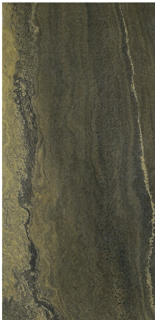
60 x 120 cm (24 x 48) Fini mat OV.SH.BWN.2448.MT