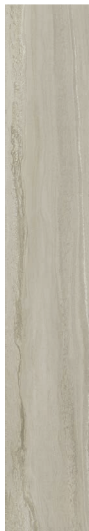
20 x 120 cm (8 x 48) Fini mat OV.SH.GRY.0848.MT.OS