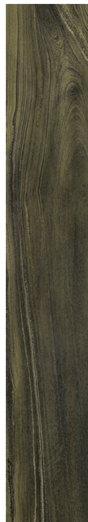
20 x 120 cm (8 x 48) Fini mat OV.SH.BWN.0848.MT.OS